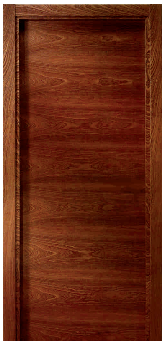
DEC. LISA CONTR.