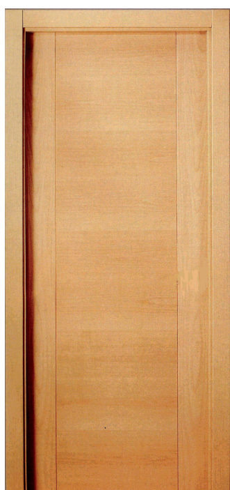
DEC. 2 R.V. Y CONTR.