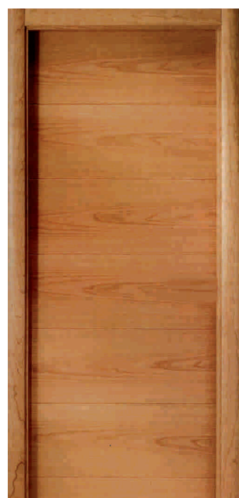
DEC. 6 R.H.