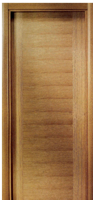
DEC. MALLA Y CONTR.