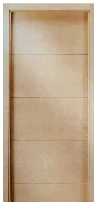
DEC. 4R. H.